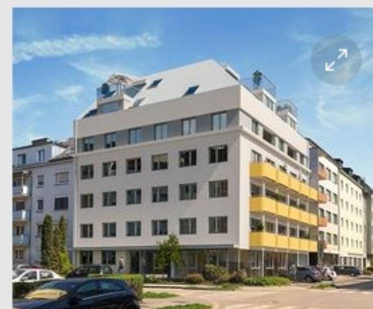
Andreas Hofer Straße