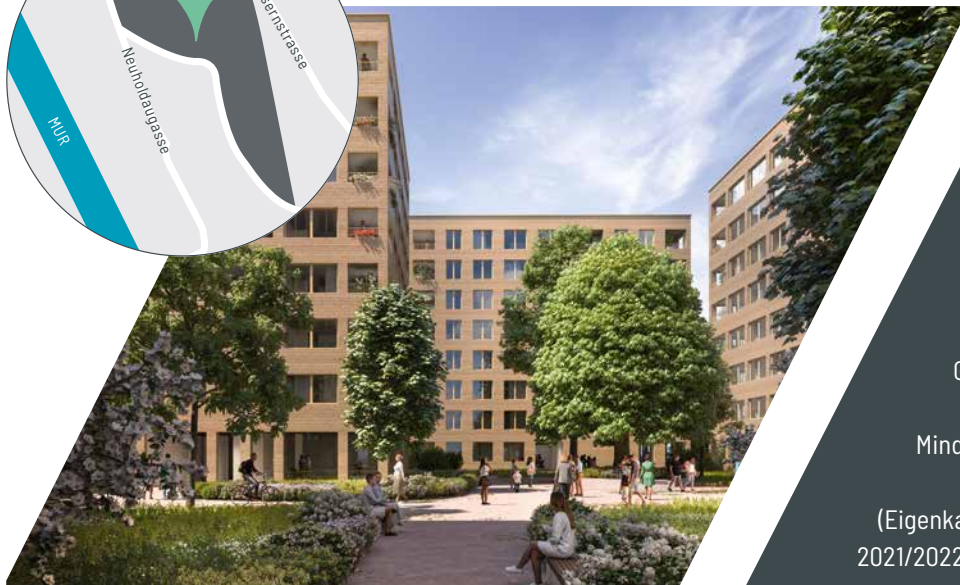
Foto und Visualisierung: Immoveate Realita GmbH, Valuita GmbH, Telegram71