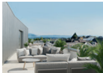
Bis 2025 entstehen in der Vöcklabrucker Franz Stelzhamer-Straße leistbare, top ausgestattete Mietwohnungen und Geschäfte.

Das Bauherrenmodell wurde geschaffen, damit mehr Private in leistbaren Wohnraum für Mieter investieren. Steuerbegünstigungen, Förderungen und Zuschüsse bringen Investoren rund vier Prozent Rendite nach Steuer. Das ist eine echte Alternative zur Vorsorgewohnung, auch weil die Beteiligung bereits ab 122.000 Euro möglich ist. Das Vöcklabrucker Objekt ist ein Garant für ein sicheres Investment. Die besonderen Merkmale lauten: die rechtskräftige Baugenehmigung, der Festpreis für die Baukosten und die Vermietungsgarantie für die Geschäfte im Erdgeschoß. Ein eventueller Leerstand wird durch die Vermietungsgemeinschaft der Investoren auf alle verteilt. Insgesamt sind die Erträge durch die indexierten Mieten gesichert.